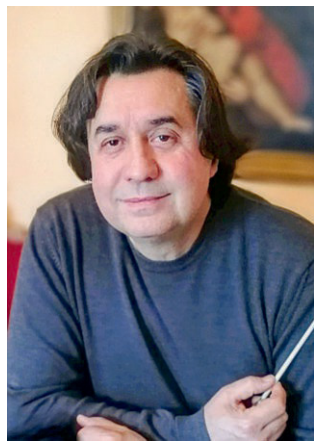
Maestro Carlo Piazza.

Sotto la direzione del maestro Carlo Piazza, salirà sul palco allestito nel chiostro dell'abbazia benedettina di Santa Maria della Neve di Torrechiara, l'Orchestra del Teatro Regio Torino, per eseguire un programma interamente dedicato a Ludwig van Beethoven (1770-1827): in scaletta, nella prima parte pagine scelte dal balletto «Le creature di Prometeo» Op.