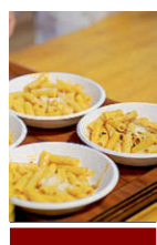
Tradizione Pastasciutta a partire dalle ore 20.

Domani a Casa Cervi a Gattatico torna la storica «Pastasciutta antifascista», la festa celebrata all'aperto ricordando l'invenzione della famiglia Cervi, che festeggiò la destituzione e l'arresto di Benito Mussolini, il 25 luglio 1943, offrendo la pastasciutta a tutti i presenti nella piazza della vicina Campegine.